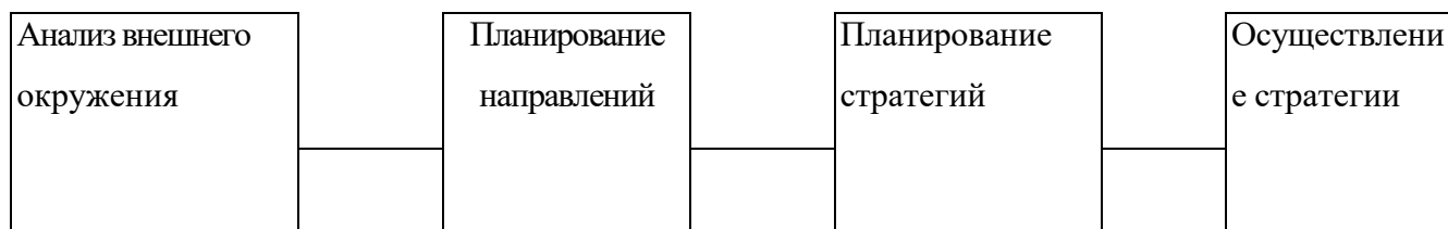
Рисунок 1 – Основные шаги стратегического менеджмента

5.5.6 Формулы и уравнения следует выделять из текста в отдельную строку по центру. Выше и ниже каждой формулы или уравнения должно быть оставлено не менее одной свободной строки. Если уравнение не уместится в одну строку, то оно должно быть перенесено после знака равенства (=) или после знаков плюс (+), минус (-), умножения (x), деления (:), или других математических знаков, причем знак в начале следующей строки повторяют. При переносе формулы на знаке, символизирующем операцию умножения, применяют знак (x).