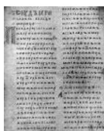
Двинская уставная грамота

Лихоимец – жадный вымогатель, взяточник».